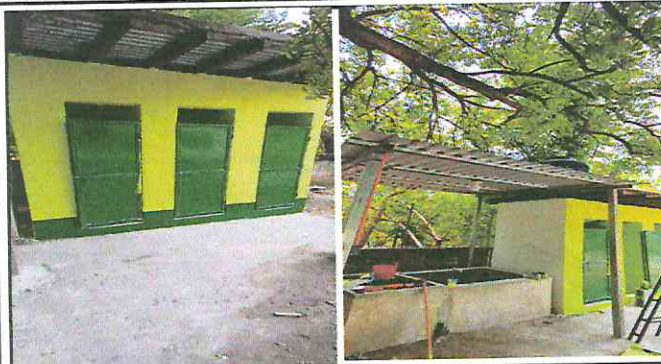
Foto1: Mantenimiento y reparación de Puertas, repello y cernido a baños, galera en la pila.