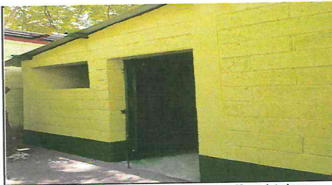
Mantenimiento y reparación de Puertas, Pintura en Muros Interiores e interiores.