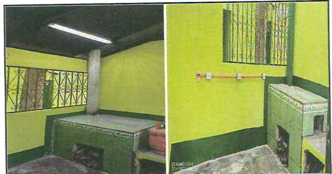
Sustitución de estufa rural, sistema eléctrico.

Observación: Si es necesario se pueden agregar hojas adicionales y actualizar el número de hojas.